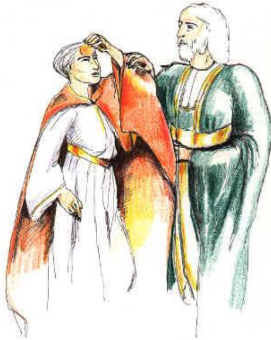
An der Stirne strahlte eine Stelle in hellem Licht