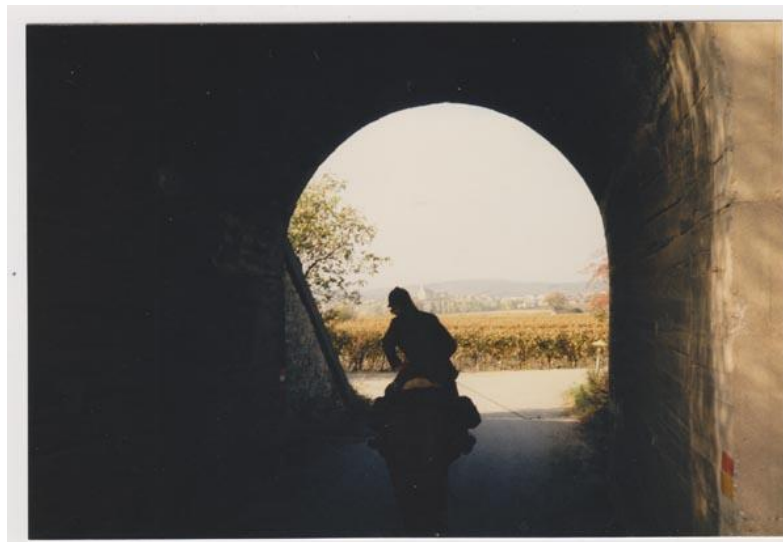
Blick durch den Tunnel

Man muss innerlich loslassen können, wenn man sich weiten möchte. Man muss sich einer inneren Führung anvertrauen können. Wie soll man etwas empfangen können, wenn man sich gleichzeitig verschließt.