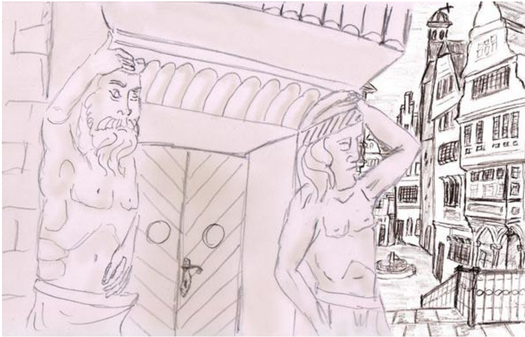
Bild aus einer Traum-Stadt

In Träumen bin ich dieser Wahrnehmung in verzückter Liebe erstmals begegnet. Das mag deshalb sein, weil man in Träumen offener ist und nicht alles logisch und skeptisch kommentiert. Es hat wohl Jahre gedauert, bis sich mein Gefühlsleben auch im Alltag genügend verfeinert hatte, bis ich auch im Alltag die Umwelt in verzückter Liebe sehen konnte. Das sah etwa so aus: