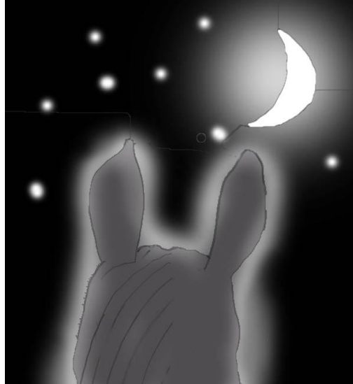
blasser Schein, Mond und Sterne

Der Weg, ob steinig oder glatt, ich weiß es nicht, ich schwebe über seiner Schwärze, kein Licht. Sicher schreitet das Pferd in die Finsternis hinein, unbeirrt zwischen Schatten und Mondenschein.