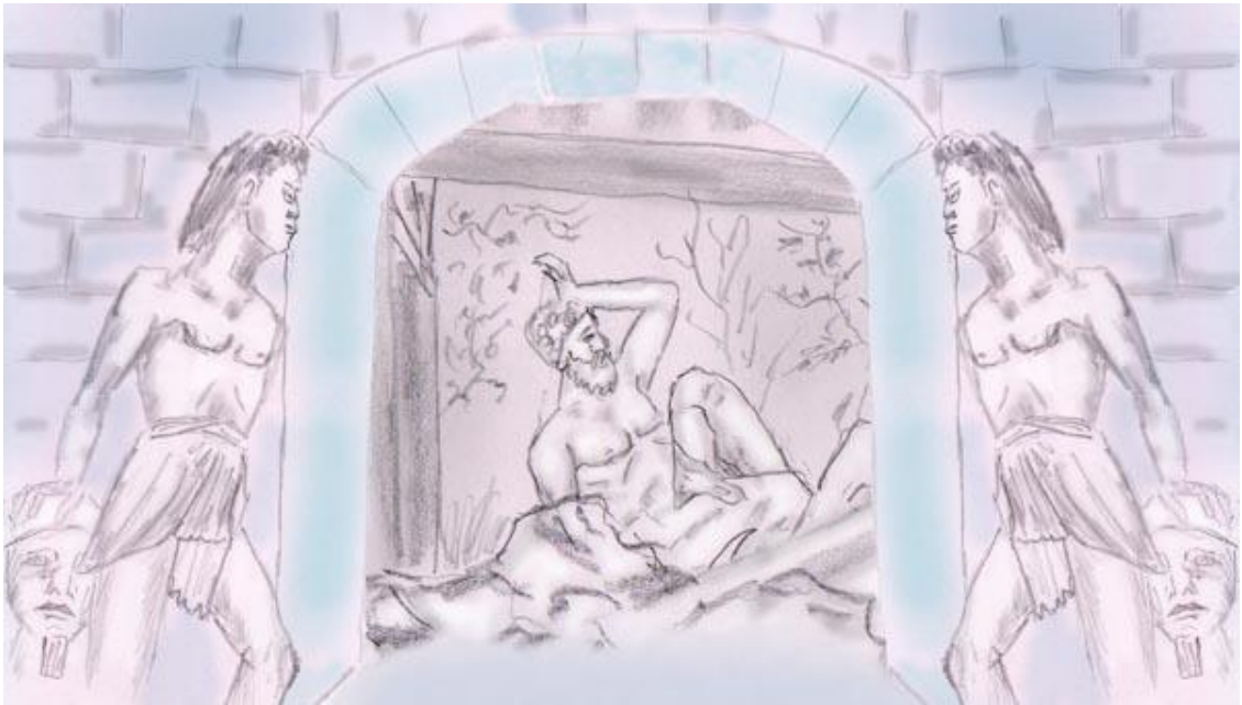
Bild aus einer Traum-Stadt

Wenn du mir nah, meine Fantasie sich schöpferisch entfaltet. Die Häuser In den Träumen sind gleich Palästen schön gestaltet. Einen Spaziergang von uns beiden durfte ich heute Nacht erleben. Du warst mir nah, es war wunderschön und hat mir viel gegeben.