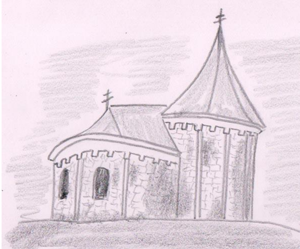
Karner (beenhuis) van Petronell aan de Donau

Het was een gewoon droom, maar iets verschillend van andere dromen. De droom was geheel realistisch, zo als gebeurde het geheel in realiteit. Toch had ik de droom zekerlijk al vergeten, als er niet iets bijzonder bij was. Het was een opwindend demonstratie over de zin van het leven.